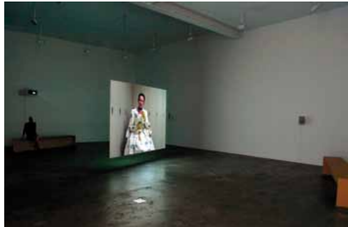
Omer Fast, Godville (2005). Instalación de vídeo, dos canales / video installation, two channels, 50'. Colección Guggenheim Museum / Collection (N. York).

MS/TB: We don’t tell artist’s what to do. They need to be comfortable with the format their work takes, rather than compromise for the market’s sake. We treat media work like any other reproducible objects, so we apply the same standards for making editions of work and providing certificates of authenticity. Multichannel video