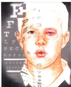
Wall Flower Series (five-piece polyptych 2005). Mixed Media / Mylar, 16.9 x 14.1 in each. Luis Adelantado Private Collection.