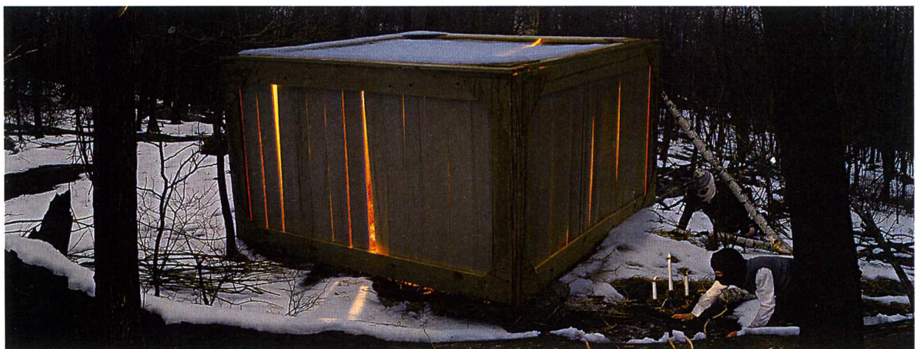
Box Trap , 2004. c-print 40 x 64 in. Edition of 9.