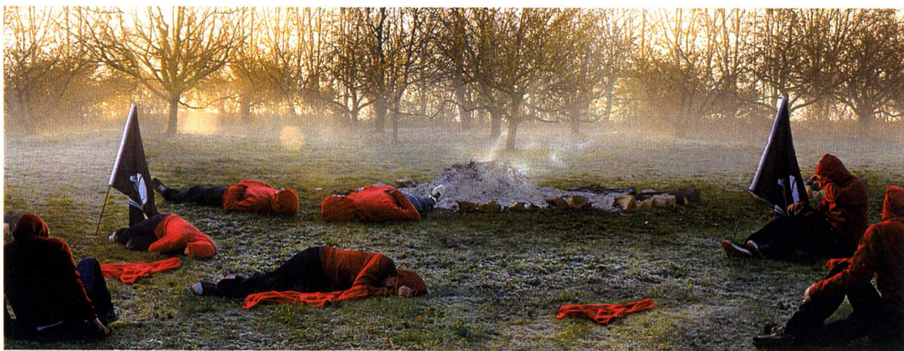
Morning Sleep, 2004. Color photograph. 40 x 104 in. Edition of 9.

Goicolea obtuvo su maestría en Escultura y Fotografía en el Pratt Institute of Art (1994-1996), y su licenciatura en Bellas Artes en la Universidad de Georgia. También cursó estudios en la Universidad de Madrid. Ha realizado numerosas exposiciones en prestigiosos centros internacionales y su obra está representada en colecciones permanentes tales como la del Museo Whitney de Arte Americano, Nueva York, NY; el Museo de Arte Moderno (MOMA), Nueva York, NY; el Museo de Arte Guggenheim, Nueva York, NY; el Museo de Arte de Brooklyn, NY; la Colección de Arte de la Universidad de Yale, Fotografía, CT; y el Museo de Arte Contemporáneo de Castilla y León, España, entre otras. También se ha hecho acreedor a importantes becas y premios por su trabajo, siendo entre ellos el más reciente la beca de la Fundación Cintas en la categoría de Artes Visuales, otorgada el mes pasado en Miami.