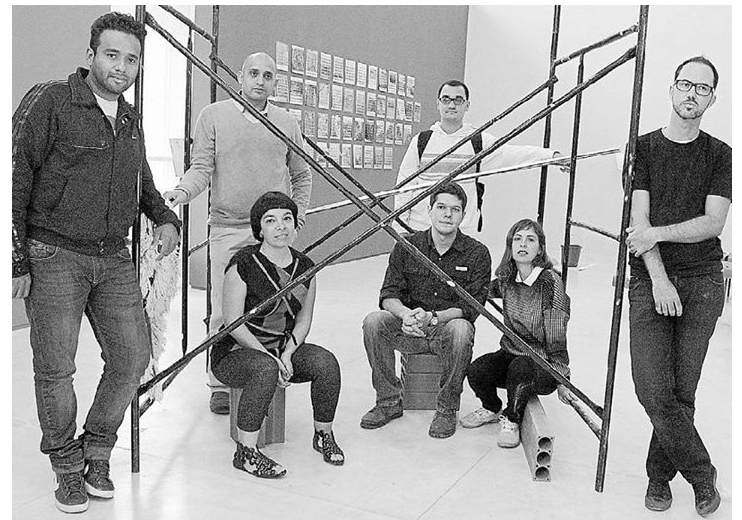
La mayoría de los artistas que participan en esta edición del premio se caracterizan por mezclar dos o varios medios en sus obras